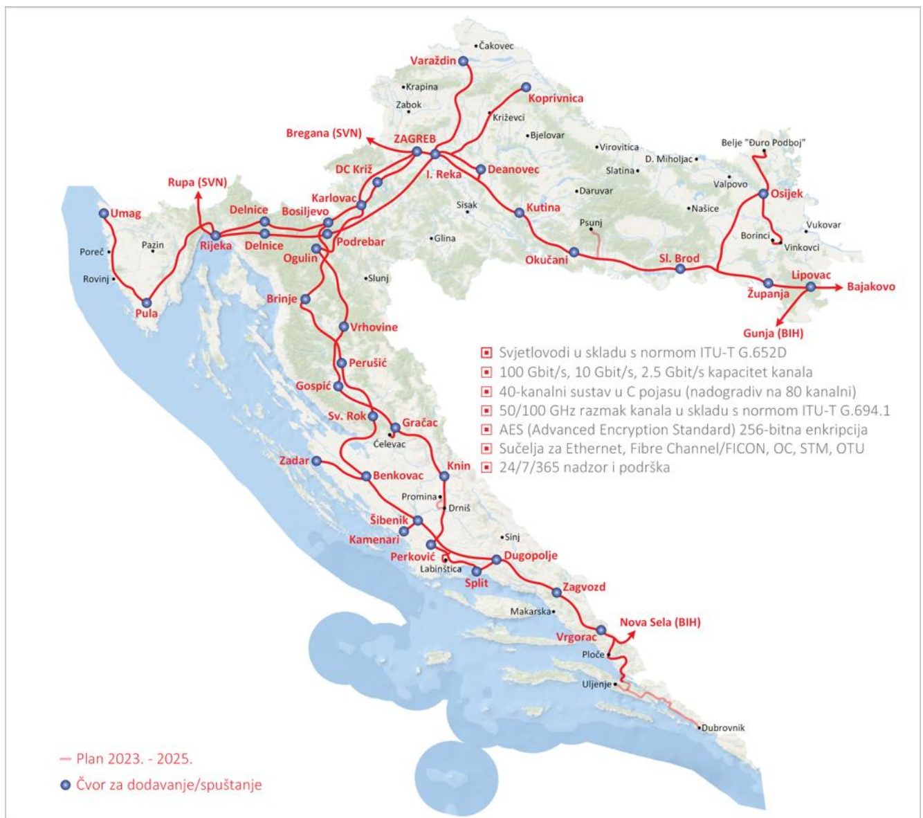
DWDM sustav – postojeće stanje i plan

Odašiljači i veze su za potrebe pružanja elektroničkih komunikacijskih usluga izgradili modernu svjetlovodnu mrežu baziranu na DWDM tehnologiji koja se kontinuirano optimizira i proširuje sukladno potrebama kupaca OIV-ovih usluga. Mreža je izgrađena korištenjem svjetlovodne infrastrukture trgovačkih društava u većinskom vlasništvu RH (ARZ, HAC, Plinacro, HŽI) te omogućuje pružanje širokog raspona usluga prijenosa telekomunikacijskog kapaciteta velikih brzina (od 2 Mbit/s do 100 Gbit/s, a uz nadogradnju i do 8000 Gbit/s) između gradova Zagreb, Rijeka, Zadar, Split, Varaždin, Osijek i dr., a koristi se i za distribuciju radijskih i TV programa te za multimedijske usluge.